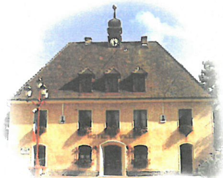
Hôtel de ville (ancienne mairie) édifié en 1609