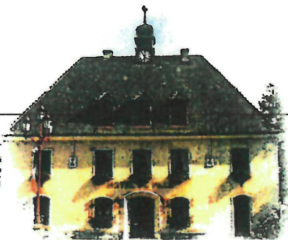
Hôtel de ville (ancienne mairie) date inconnue